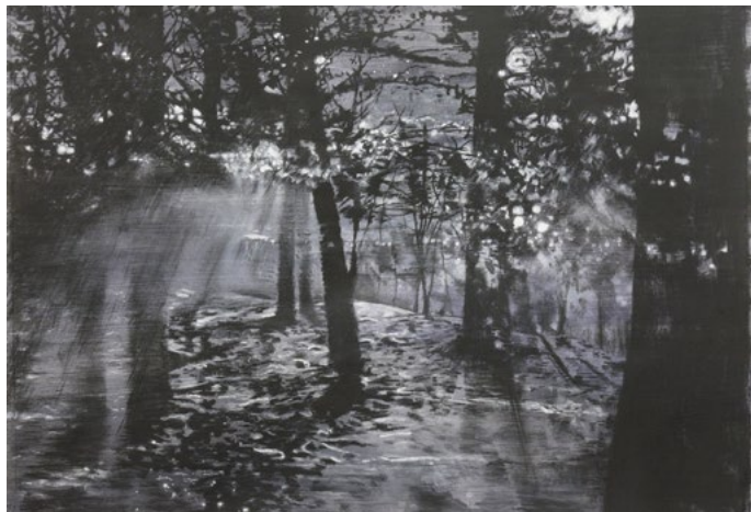
Abb.: Johanna Staniczek, „Winternacht“, 2015, 70 x 100 cm, Acryl/Pigmente, Kohle auf Papier

Dienstag, Donnerstag und Freitag | 10–17 Uhr Mittwoch | 10–19 Uhr | feiertags geschlossen