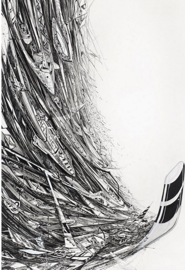
Abb.: Katrin Günther, „Aufwind“, 2020, Tusche, Acryl auf Leinwand, 160 x 120 cm

Während sich Auffassungen von Ewigkeit und Unendlichkeit unserer Vorstellungskraft entziehen, entfaltet das Kunstwerk selbst ganz eigene Zeitlogiken. In seiner dokumentarischen Qualität kann es als Zeitmarker einer Vergangenheit verstanden werden. Gleichzeitig bindet es seinen Betrachter durch den Moment des Betrachtens an ein Hier und Jetzt , wie es Walter Benjamin bezeichnete. Parallel weckt das Kunstwerk als Artefakt den Wunsch des Bewahrens – es soll am besten in aller Ewigkeit fortbestehen.