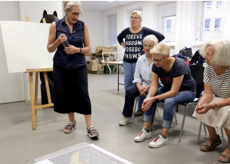
Abb.: Teilnehmerinnen der Feierabendkunst im Gespräch über die entstandenen künstlerischen Arbeiten, 2025