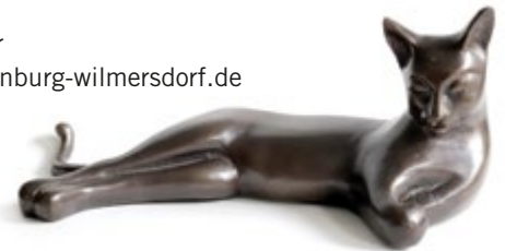
Unbekannter Künstler, Katze, n. d., Bronze

Anmeldung unter atelier@charlottenburg-wilmersdorf.de