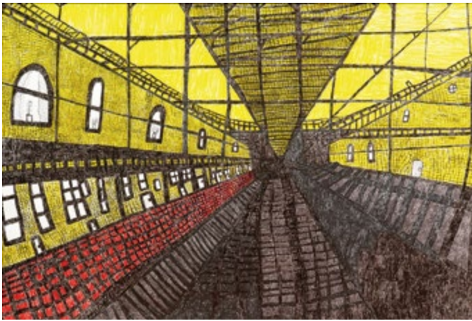
Abb.: Luis Edler, Der gelbe Bahnhof, Filzstift