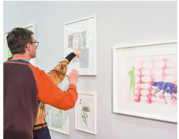
Abb.: Blick in die Ausstellung „ÄTZEN - KRATZEN - STECHEN“, 2024