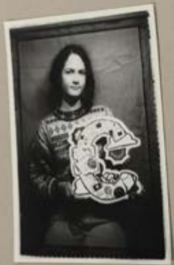
Abb.: Aus dem Workshop „Freiheit“ für ukrainische Willkommensklassen