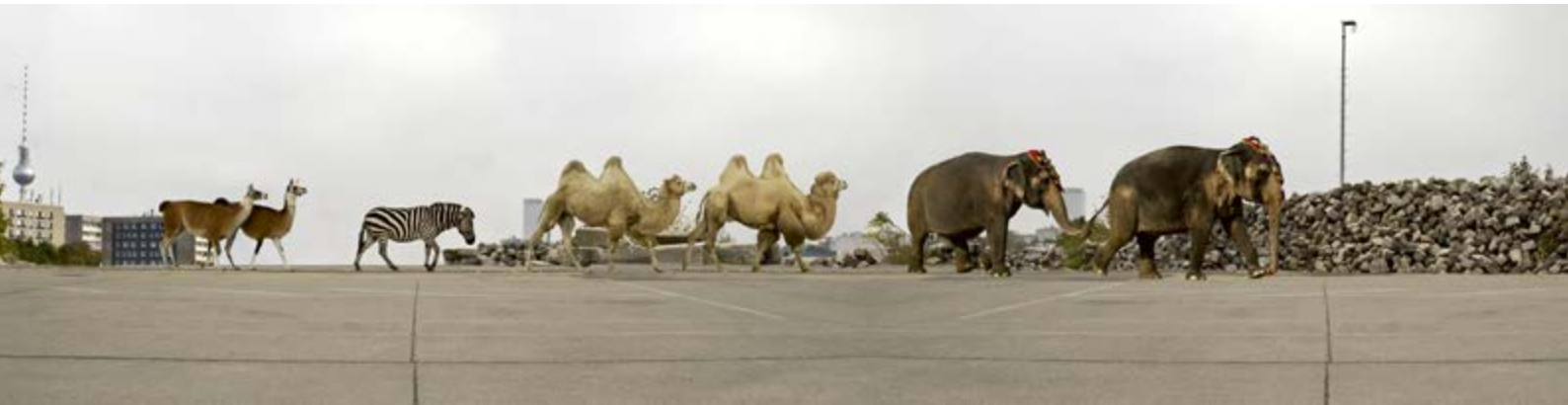
Abb.: Simone Haeckel, Europaplatz, Fotografie, 40 x 160 x 3 cm