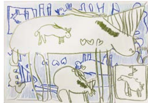
Abb.: Atalya Laufer, Untitled, 2022 Buntstifte auf Papier

Anmeldung unter atelier@charlottenburg-wilmersdorf.de