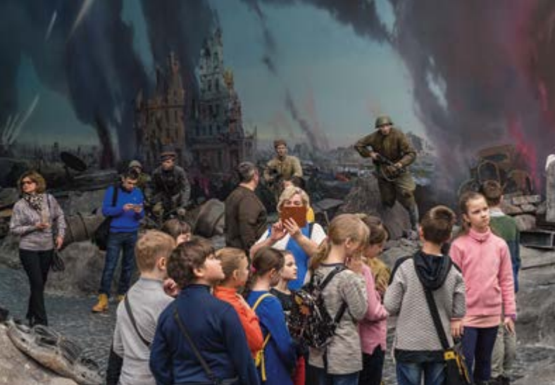
Abb.: © Frank Gaudlitz, Zentralmuseum des Großen Vaterländischen Krieges, Moskau, Russland 3/2018, aus: RUSSIAN TIMES 1988–2018