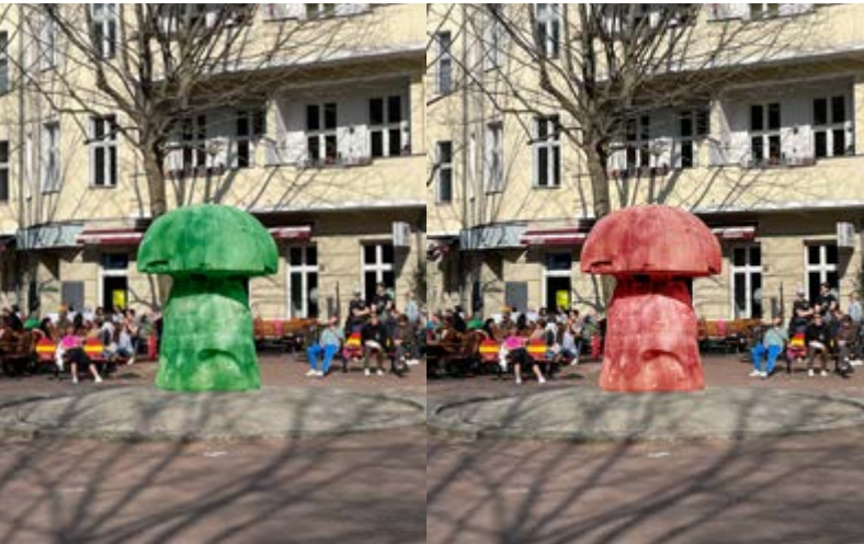
Abb.: Photoshop Bearbeitung vom „Wasserpilz“ am Leon-Jessel-Platz im „Actionbound“/ von Schüler*innen der 12. Klasse / Leistungskurs Kunst – Heinz-Berggruen-Gymnasium

Sie stehen überall. Sie gehören zum Berliner Straßenbild und sind doch meist unsichtbar. Skulpturen im öffentlichen Raum werden oft übersehen. Dabei erzählen Pilze, Antilopen und Märchenfiguren eigene Geschichten und laden zum Betrachten ein. Schüler*innen des Heinz-Berggruen-Gymnasiums haben im Frühjahr 2022 die Skulpturen rund um den Fehrbelliner Platz künstlerisch und spielerisch erschlossen. Entstanden sind drei interaktive Rundgänge.