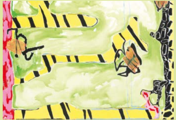
Abb.: © Josephine Hans, Tiger (Aus der Schleimreihe), Detail, 2023