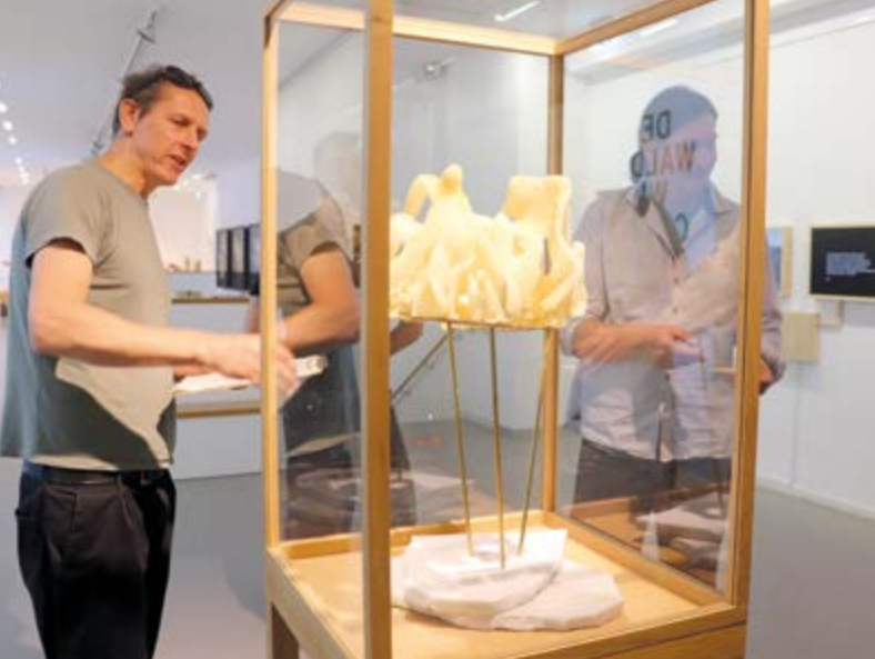
Abb.: Blick in die Ausstellungen der Kommunalen Galerie Berlin, 2023