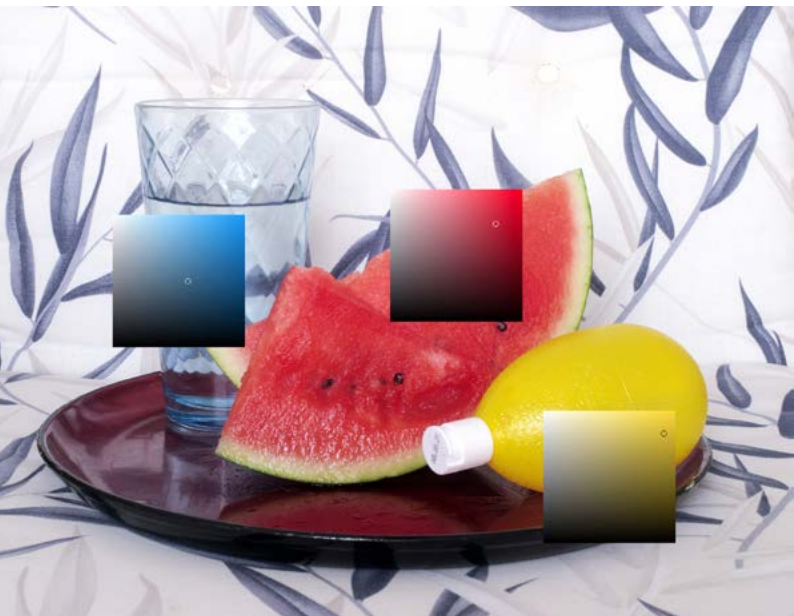
Abb.: Fred Hüning, Keine Angst vor Rot, Gelb und Blau