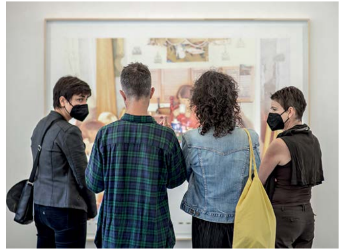
Abb.: Besucher*innen in der Ausstellungen, Hiersein, Being Here, כאן תוהיל – Gruppenausstellung anlässlich des Festjahres 1700 Jahre jüdisches Leben in Deutschland, kuratiert von Birgit Szeponski, 2021