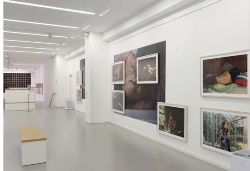
Abb. rechte Seite: Blick in die Ausstellung „Hi How Are You“ – Meisterklasse Ute Mahler und Ingo Taubhorn - Ostkreuzschule für Fotografie

aktuelle Infos zu den Hygieneregeln unter www.kommunalegalerie-berlin.de