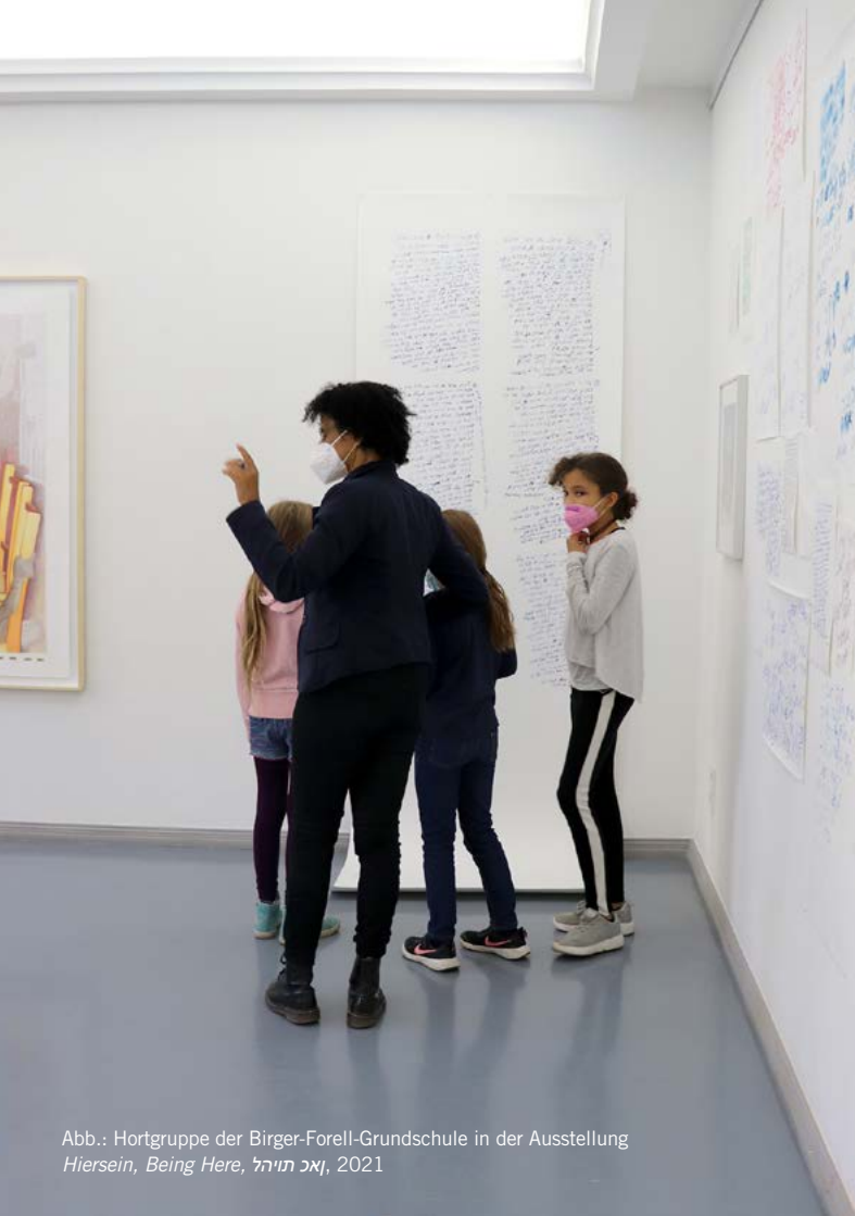
Abb.: Hortgruppe der Birger-Forell-Grundschule in der Ausstellung Hiersein, Being Here, כאן תוירל , 2021