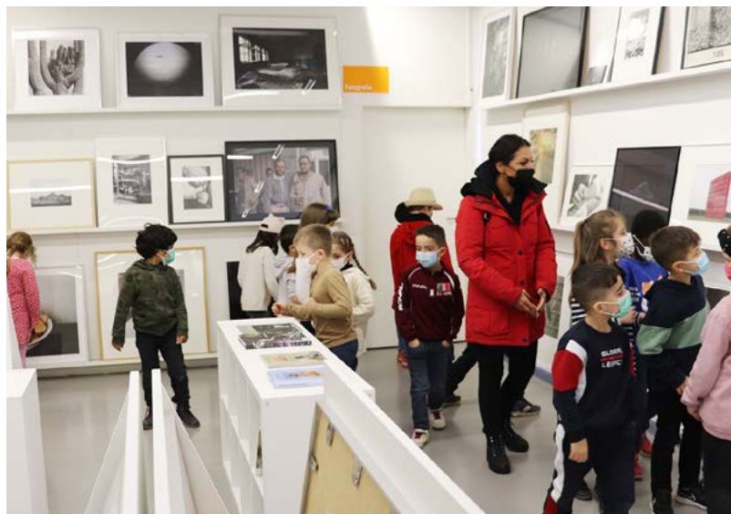
Abb.: Kinder der 1. und 2. Klasse der Johann-Peter-Hebel-Grundschule.

45 Minuten, Gruppengröße auf Anfrage, mit Voranmeldung, kostenfrei mit Sigrun Adam-Angermann