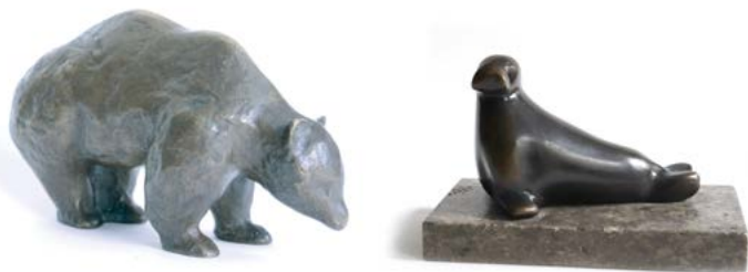
Abb.: Tierskulpturen zum Ausleihen gibt es in der Artothek.