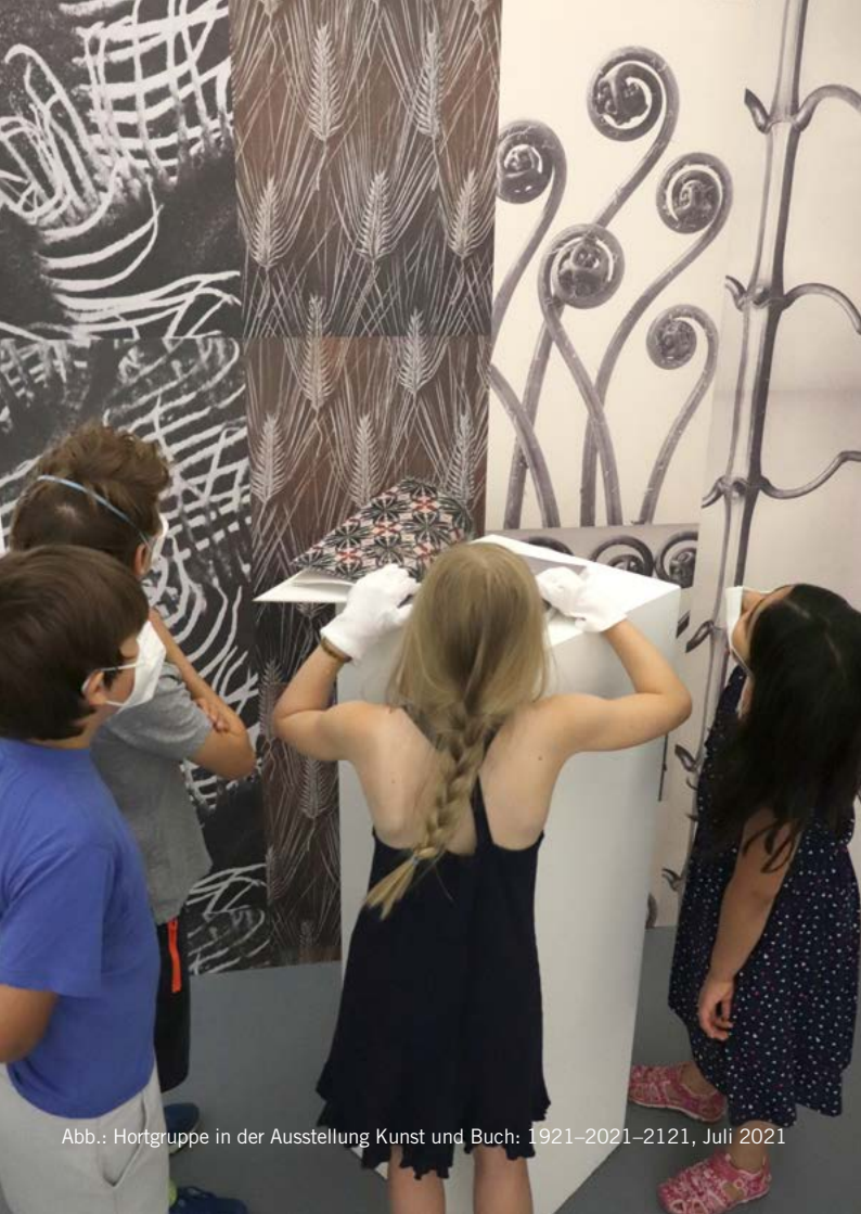
Abb.: Hortgruppe in der Ausstellung Kunst und Buch: 1921–2021–2121, Juli 2021