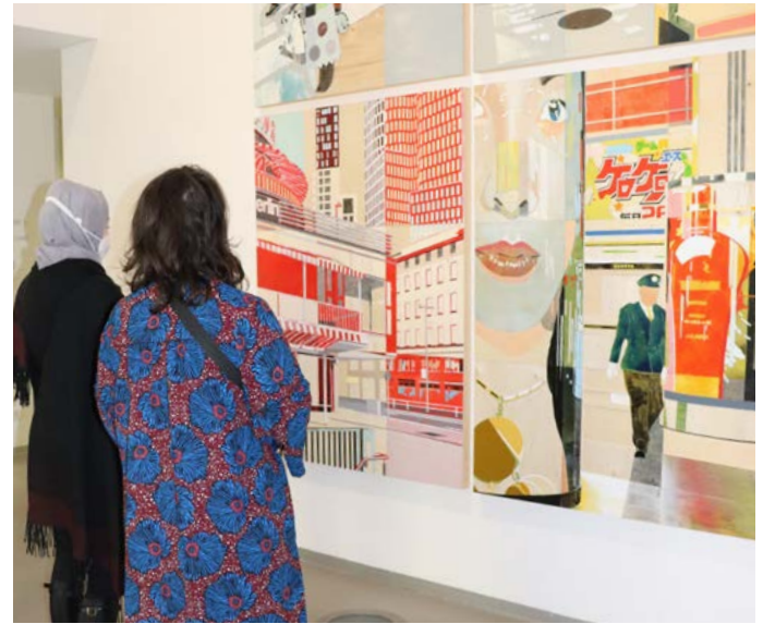
Abb.: Besucher*innen vor einer Installation von Detlef Waschkau, 2021