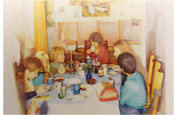
Abb.: Olaf Kühnemann, „Grid References“, 2020/2021, Buntstifte auf Papier, 145 cm x 177 cm

Die Ausstellung möchte einem breiten Publikum aktuelle Perspektiven auf das deutsch-jüdische Stadtleben zugänglich machen. Sieben zeitgenössische Künstler*innen präsentieren mit Zeichnung, Malerei, Fotografie, Konzeptkunst und Comic ihre individuellen und kritischen Sichtweisen auf Familie, Herkunftsorte, Identitäten und die jüdische und deutsche Geschichte. Die inhaltliche Vielfalt spiegelt sich in der Spannweite der künstlerischen Medien wider.