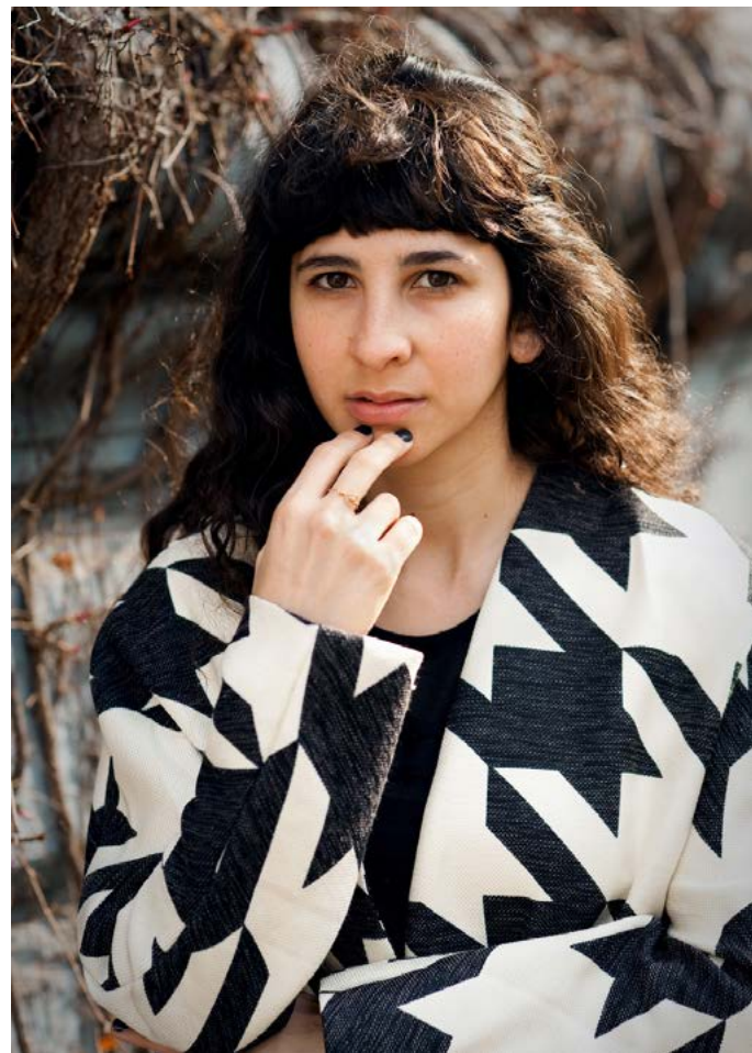
Abb.: Heike Steinweg, Shiran, Serie Open History, 015, C-Print, 50x70 cm

aktuelle Infos zu den Hygieneregeln unter www.kommunalegalerie-berlin.de