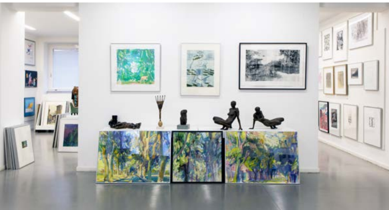
Abb.: Ansichten aus der Artothek